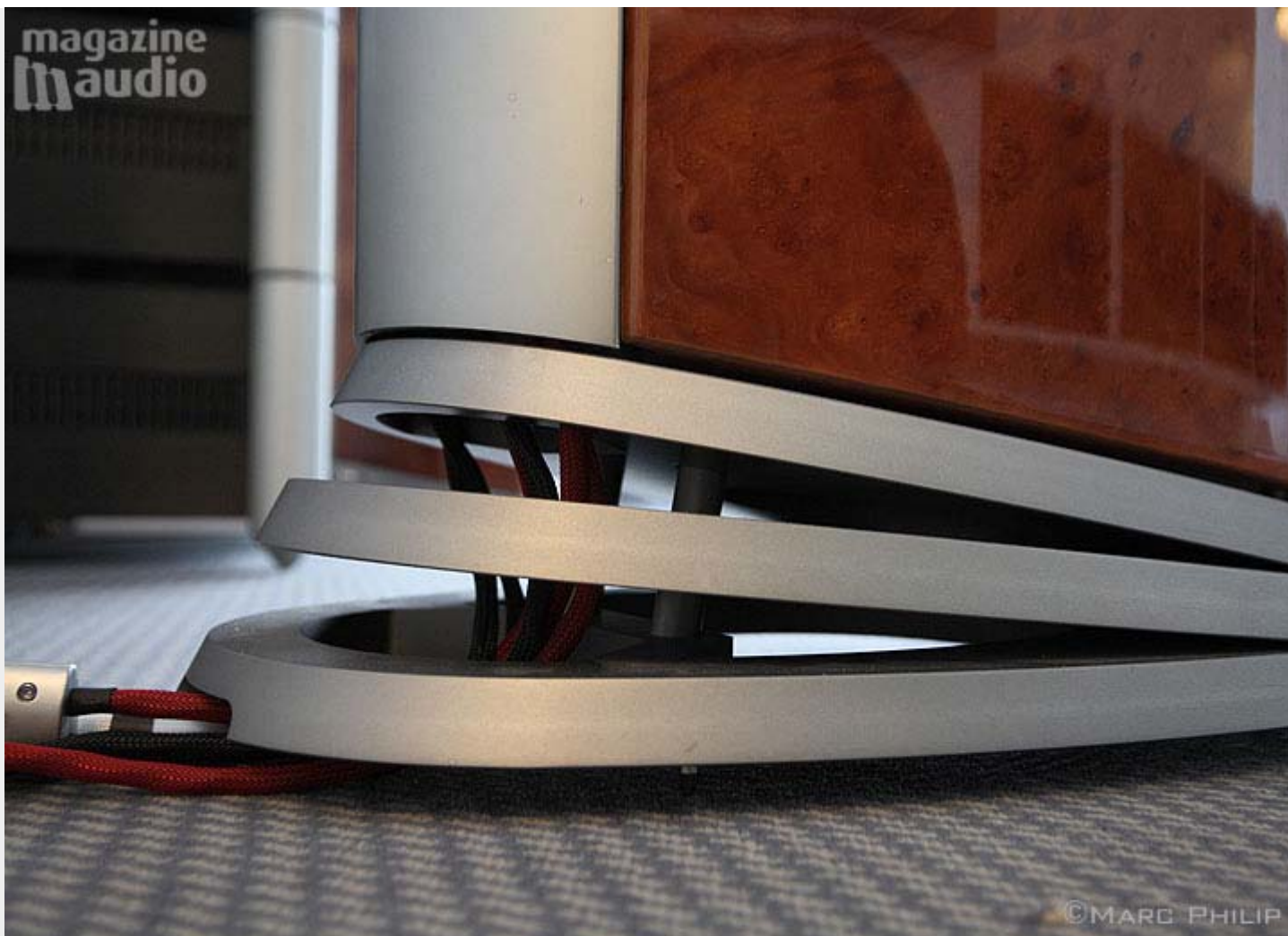
Système de couplage et découplage exclusif à Audiovector

Ces gens là ont tout compris, ils ont poussé l'aspect purement technique à son paroxysme et ça s'entend!