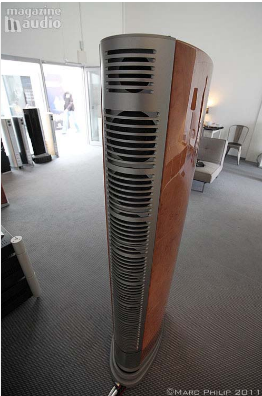
Vue arrière des enceintes Audiovector

Il fallait venir s'asseoir ici un instant pour vraiment vivre une belle écoute, avec des exposants qui en plus d'être des techniciens sont aussi des mélomanes avertis, gourmands de nous faire entendre leur derniers coup de cœur, ce qui à fini de nous convaincre de rester un peu plus 😊