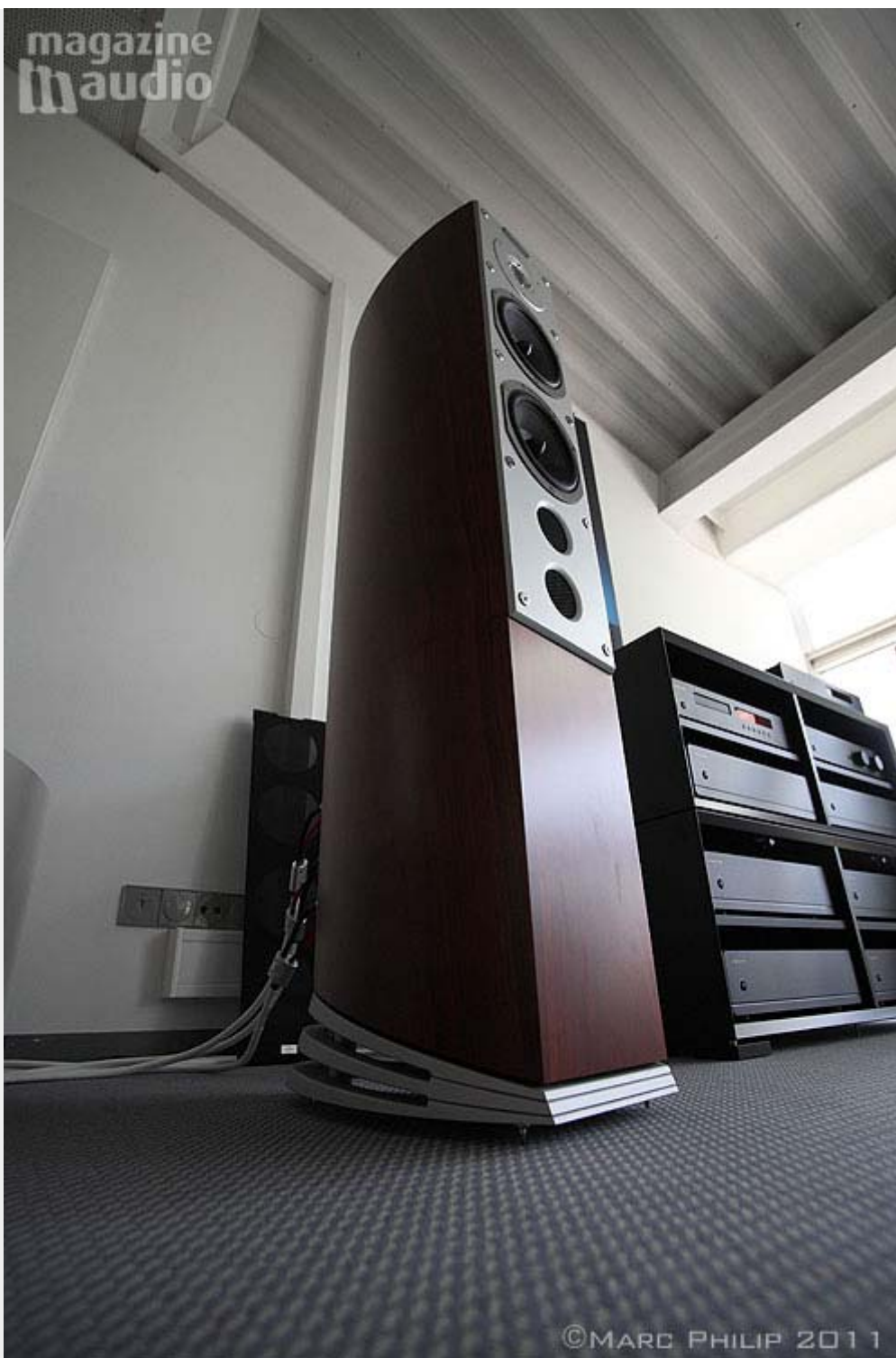
Système secondaire avec les SR6 dans la pièce à côté

Si vous regardez attentivement vous verrez que l'enceinte repose sur une sorte d'éventail en métal dont les strates sont amorties en arrière par un plot de caoutchouc extrêmement rigides, ceci afin de ne pas dénaturer le son, ni induire de mouvement de caisse, le point dur se situe en avant, comme la logique l'impose.